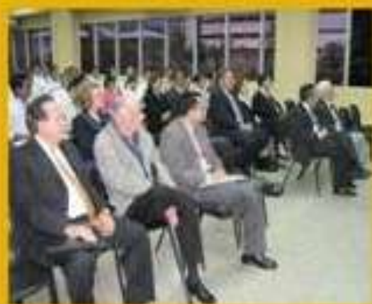
* Público asistente