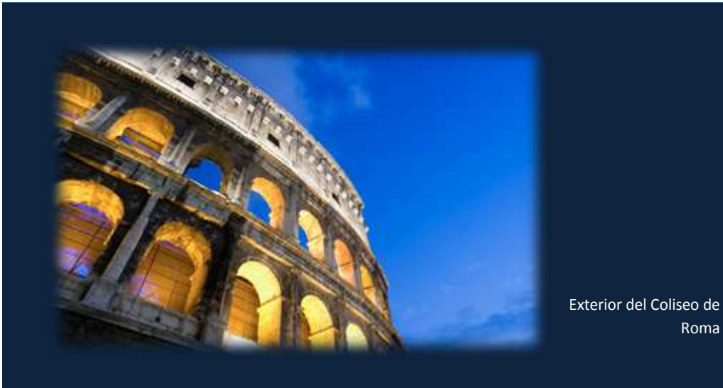
Exterior del Coliseo de Roma

“Es de importancia para quien desee alcanzar una certeza en su investigación, el saber dudar a tiempo”.